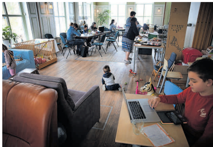
Oekraïense vluchtelingen in De Moeting in Tzum.

Hoeveel opvangplekken er uiteindelijk nodig zijn, is nog onbekend. De Veiligheidsregio houdt er al rekening mee dat Fryslân de vraag krijgt méér dan 2000 plekken te leveren. „Er zijn nog mensen onderweg vanuit Polen. Hoeveel daarvan naar Nederland komen is nog onbekend”, aldus De Haan.